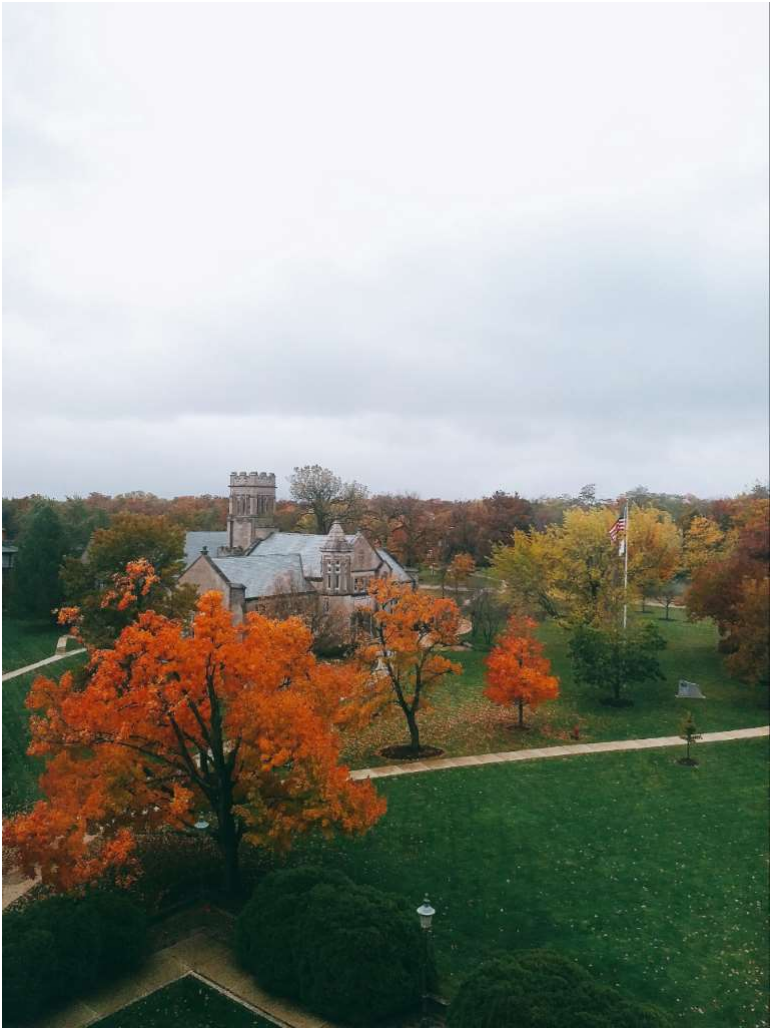
#nofilterneeded – Trang Linh Do