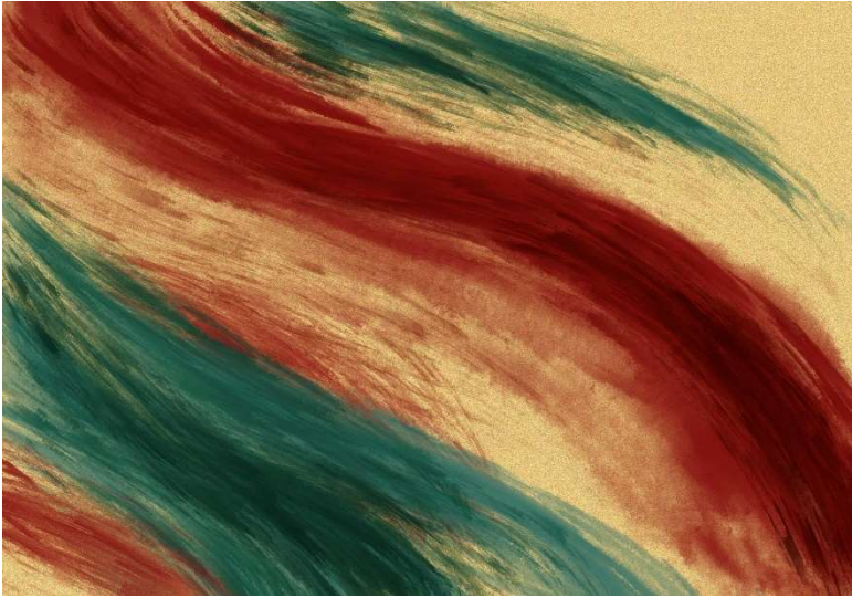
霓裳羽衣 – Yuxin Chen